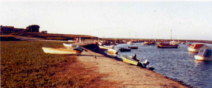
Sønderho Naturhavn ca. 1980.

Færdsel ved Sønderho Havn er på eget ansvar. Der kan være blød bund langs kanten af renden. Børn bør være under opsyn af voksne.