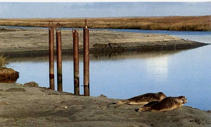
To sæler slog sig ned ved den uddybede sejlrende i november 2020.

Sønderho Havn Støtteforening har i samarbejde med Fanø Kommune uddybet tidevandsrenden Slagters Lo, der siden 1990'erne har været tilsandet. Fra 2021 kan man igen sejle med mindre både til og fra Sønderho.